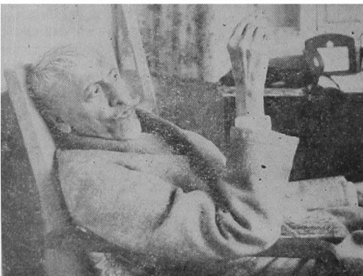
Maulana Abul Kalam Azad

Resolutions opposing the proposal of Choudhry Khaliqzaman for "complete exchange of minorities between India and Pakistan" and condemning the "sad happenings" both in the East and West Bengal were passed at a meeting of the Delhi Muslims held in the Jumna Masjid. Mir Mustaq presided. The meeting also appealed to the people of both East and West Bengal to use "wisdom and other nobler instincts instead of falling victims to passion and baser self." The meeting also urged upon Government of India to stop "the